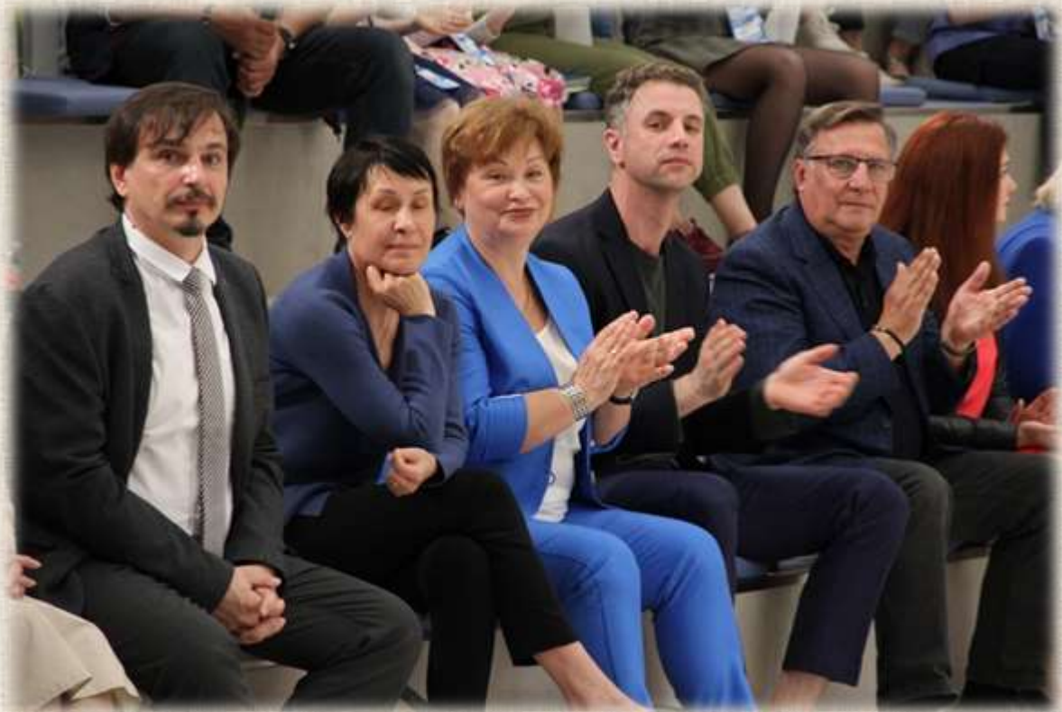
Организаторы, жюри и почётные гости конкурса «Моя Россия»